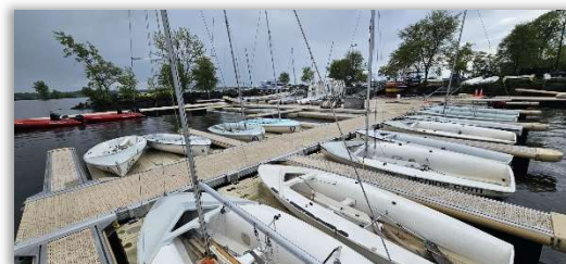
Nouvelles sections et « Ezdocks »